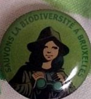
Editeur Responsable: Connaissance & Protection de la Nature du Brabant